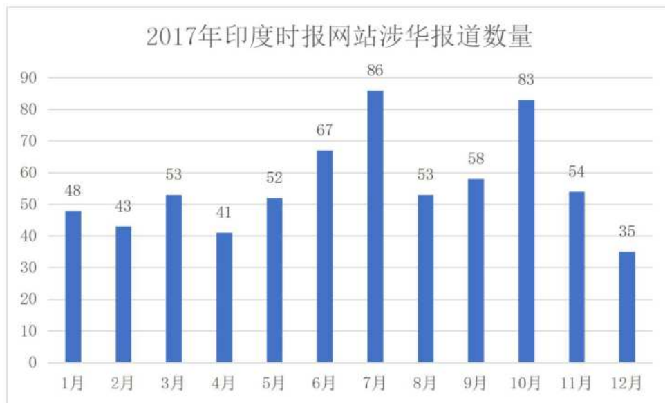
图 2 2017 年印度时报网站每月的涉华报道数量

于印度的重要性是不言而喻的，特别是在基础建设、金融软件服务业和两国经济贸易往来等方面，中印之间存在很强的互补性。只要两国能够建立友好的互信机制，把握经济发展机遇，合作共赢，推动两国关系发展，就能实现两个大国的共同崛起。