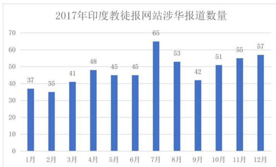
图 3 2017 年印度教徒报网站每月的涉华报道数量