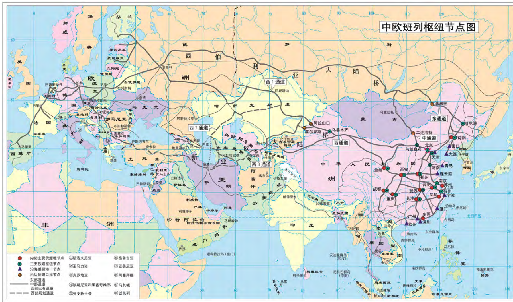
图 3 中欧班列枢纽节点规划图