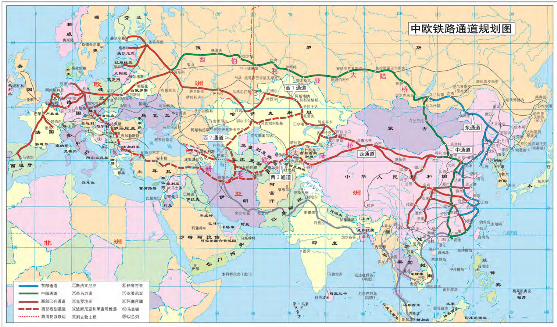
图 1 中欧铁路通道规划图